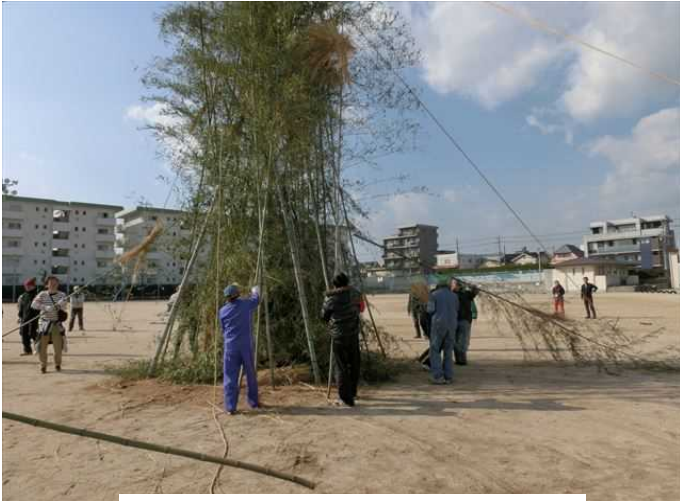
吉島学区とんどまつり準備状況