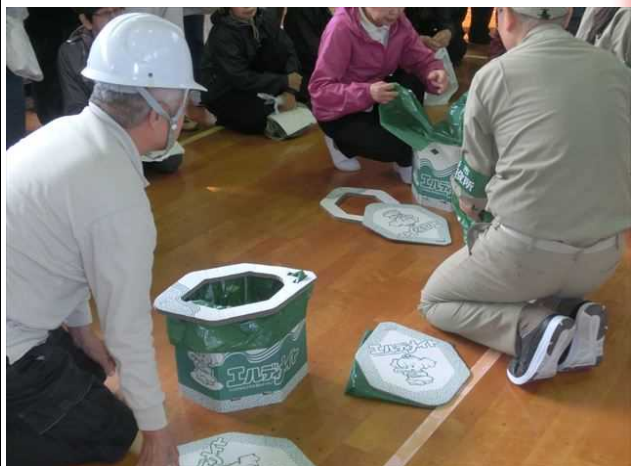
簡易トイレ作りの説明状況