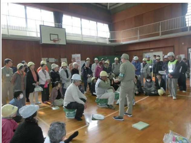
吉島学区防災訓練の説明状況